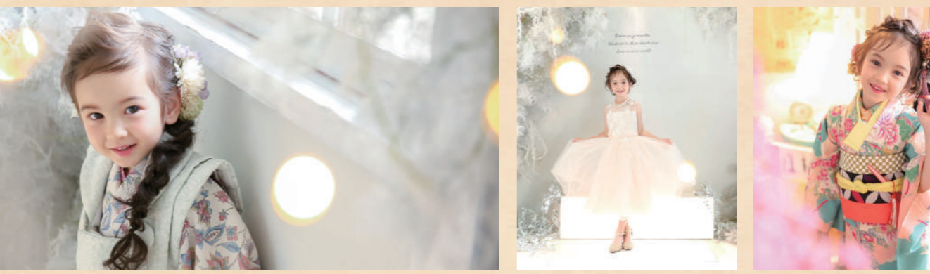
フレームやアルバムなどの商品はオプションとして追加でご注文いただけます。詳しくは→www.studio-ism.jp